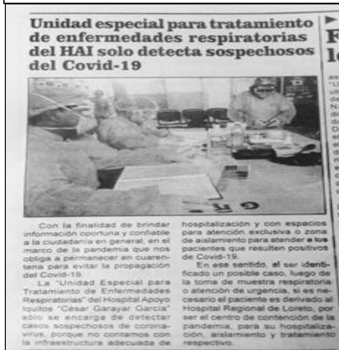
Figura 02: Recorte periodístico - Unidad especial COVID - Hosp. Iquitos