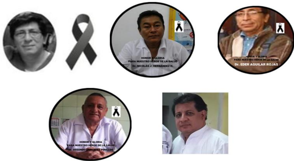
Figura 03: Médicos héroes del Hospital Iquitos.